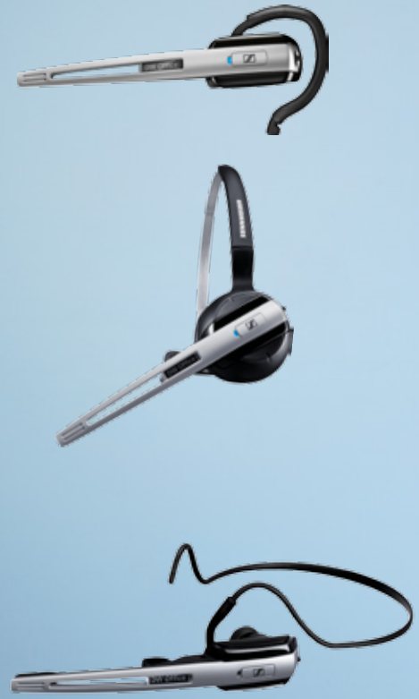
HINWEIS: Der Nackenbügel ist erhältlich als Zubehör